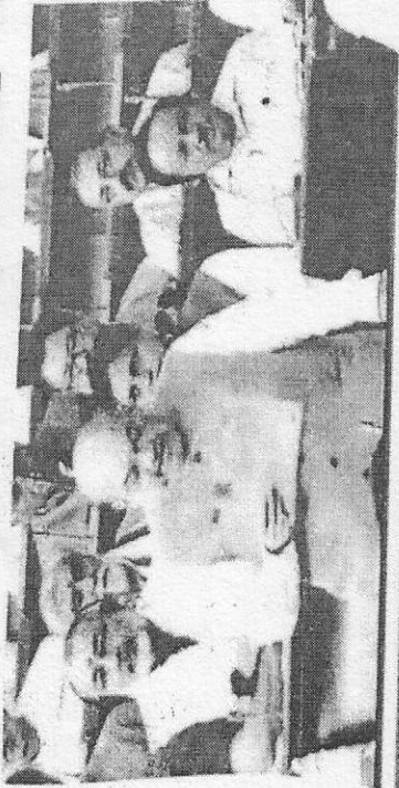
कागपट्टी पर गन रखकर नहीं ला सारते बाहर